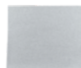
Finishpapier Bogen 3M